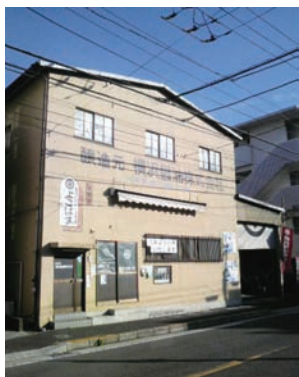
大口駅から徒歩10分